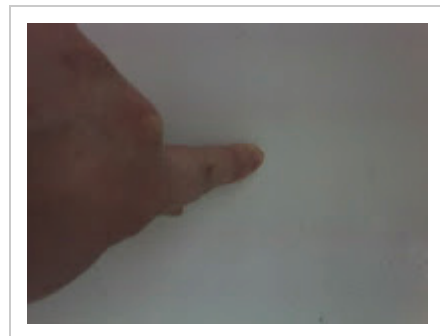
hier sieht man den hohen Widerstand

Ein weiterer Vorteil ist die Sparsamkeit. Eine einmalige Anwendung genügt und die Wirkung hält über Jahre. Dabei kann die behandelte Oberfläche wie gewohnt gereinigt werden. Egal wie oft man reinigt, die Wirkung bleibt konstant gleich. Keine Abnutzungserscheinungen machen sich bemerkbar.